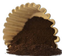
Granos de café y filtros