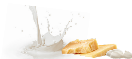
Productos lácteos (leche, queso y yogur)