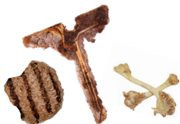
Carne y huesos

ARROJE LOS ELEMENTOS ENUMERADOS A CONTINUACIÓN EN ESTE CONTENEDOR