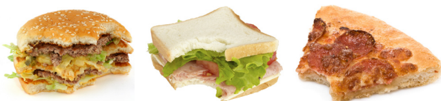
Granos, aceites y grasas