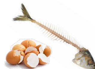
Conchas de huevo y pescado